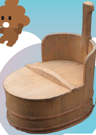
木製おまる (当館蔵)