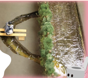
古代の水洗トイレ模型 (大田区立郷土博物館蔵)

発掘調査で確認された古代の都のトイレは、水を利用してウンチを流すものもありました。