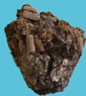
鴻臚館跡出土の古代ウンチ (福岡市埋蔵文化財センター蔵)