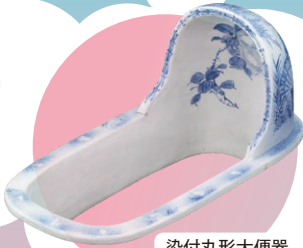
染付丸形大便器 (当館蔵)