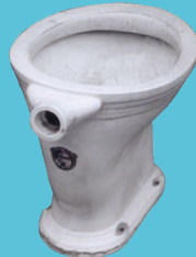
国産初の腰掛式水洗便器