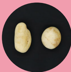
おしりふきとして使われた小石